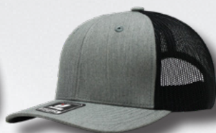
HEATHER GREY - BLACK