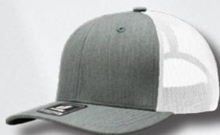
HEATHER GREY - WHITE