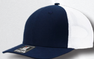
NAVY - WHITE