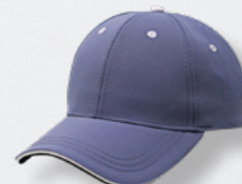
STEEL/WHITE HASTA AGOTAR EXISTENCIAS