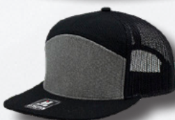
BLACK HEATHER GREY BLACK