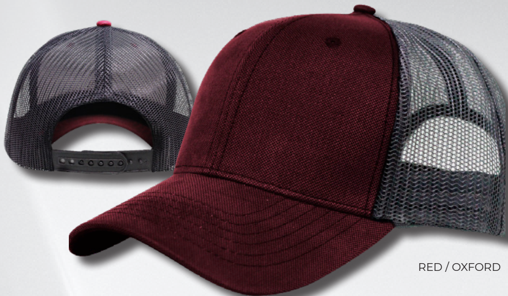
RED / OXFORD