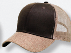
BROWN / KHAKI