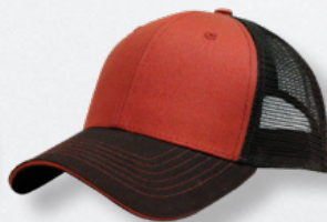
TX ORANGE / BROWN