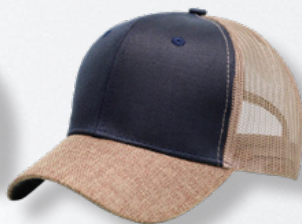
NAVY / KHAKI