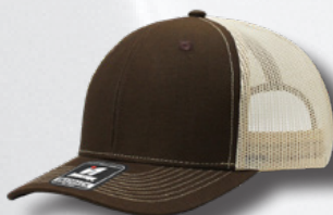
BROWN - STONE