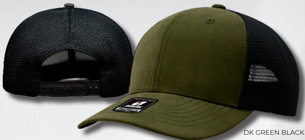
DK GREEN BLACK