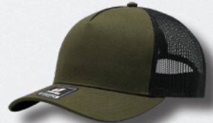
OLIVE / BLACK