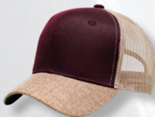
RED / KHAKI