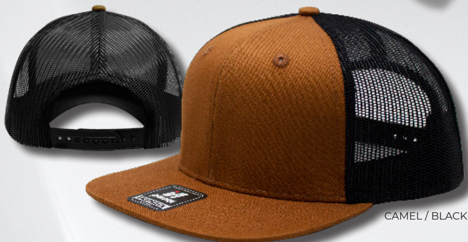
CAMEL / BLACK