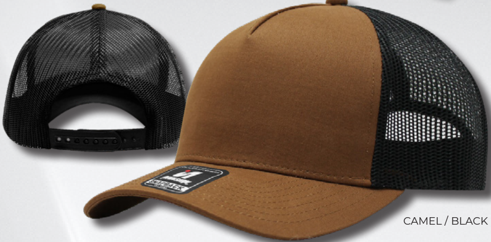
CAMEL / BLACK