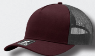
WINE / OXFORD