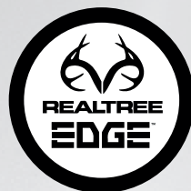
EDGE 02 CAMO MESH BROWN