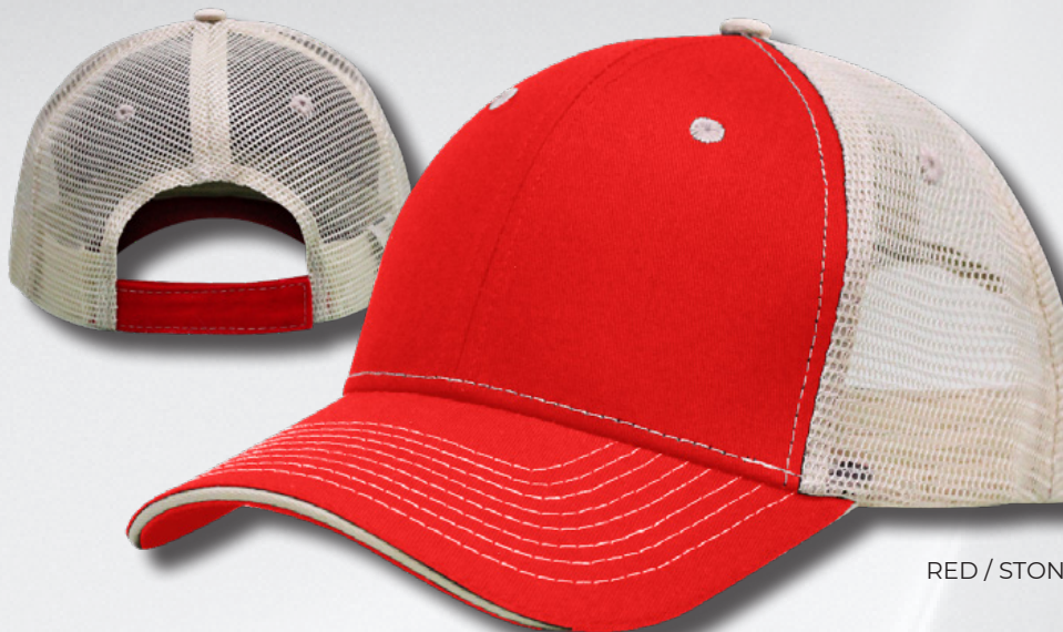
RED / STONE