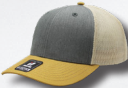
HEATHER GREY - MUSTARD-STONE