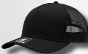
BLACK / BLACK