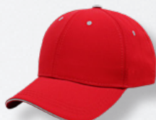
RED/GREY HASTA AGOTAR EXISTENCIAS