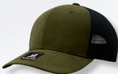
DK GREEN BLACK