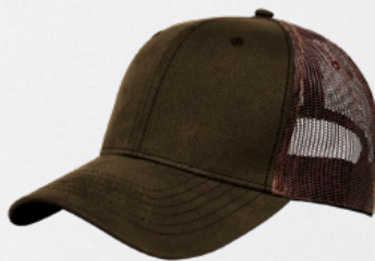
BROWN / LT BROWN