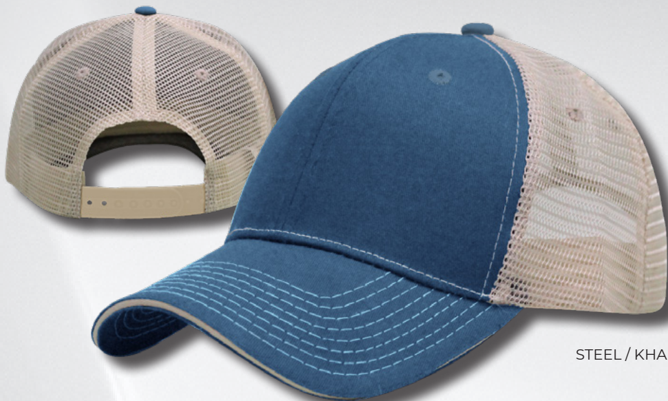
STEEL / KHAKI