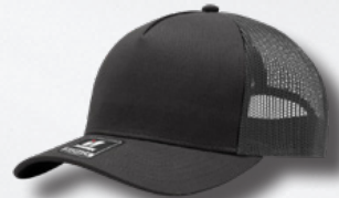
CHARCOAL / OXFORD