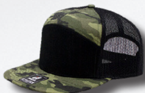
BLACK CAMO BLACK