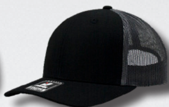
BLACK - OXFORD