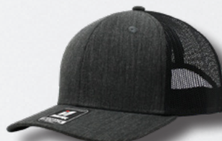
HEATHER BLACK - BLACK