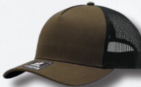
BROWN / BLACK