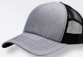
HEATHER GREY/ BLACK