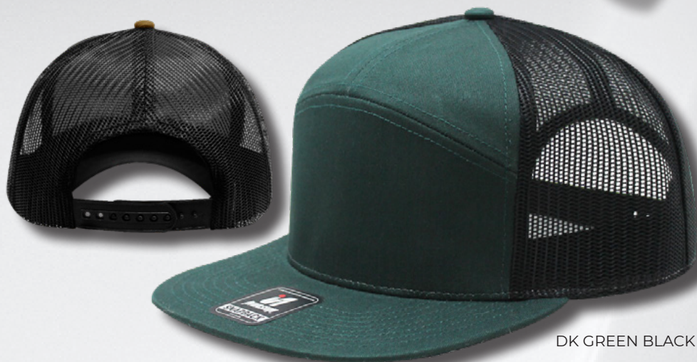
DK GREEN BLACK