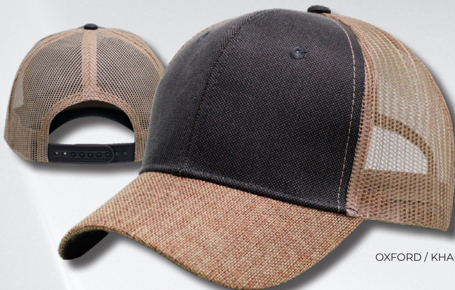
OXFORD / KHAKI