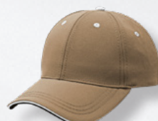
LT BROWN/WHITE HASTA AGOTAR EXISTENCIAS