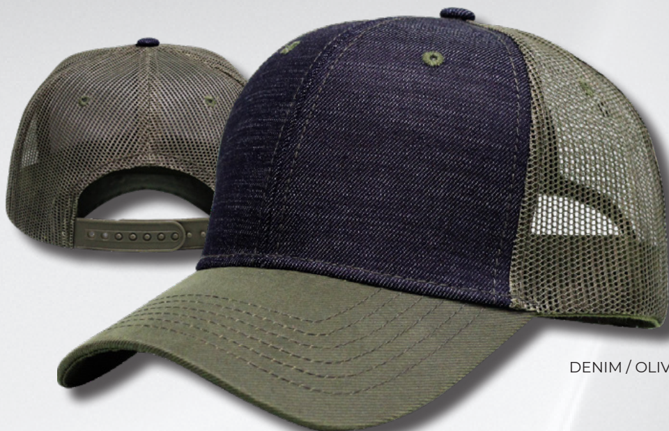
DENIM / OLIVE