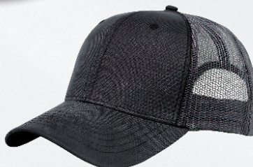
GREY / OXFORD