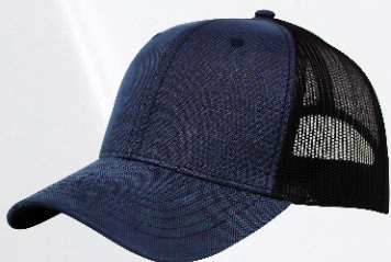
NAVY / BLACK