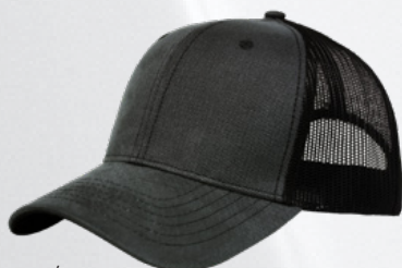
GREY / BLACK