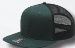
DK GREEN BLACK